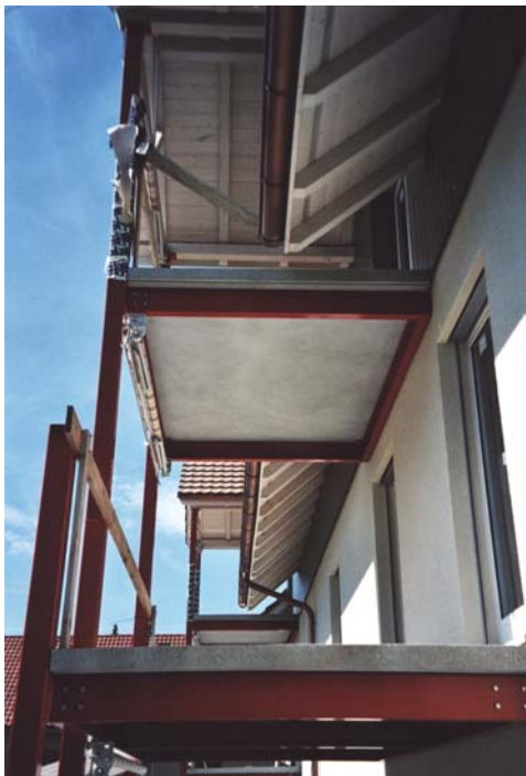
Es muss nicht immer metallfarbig sein!