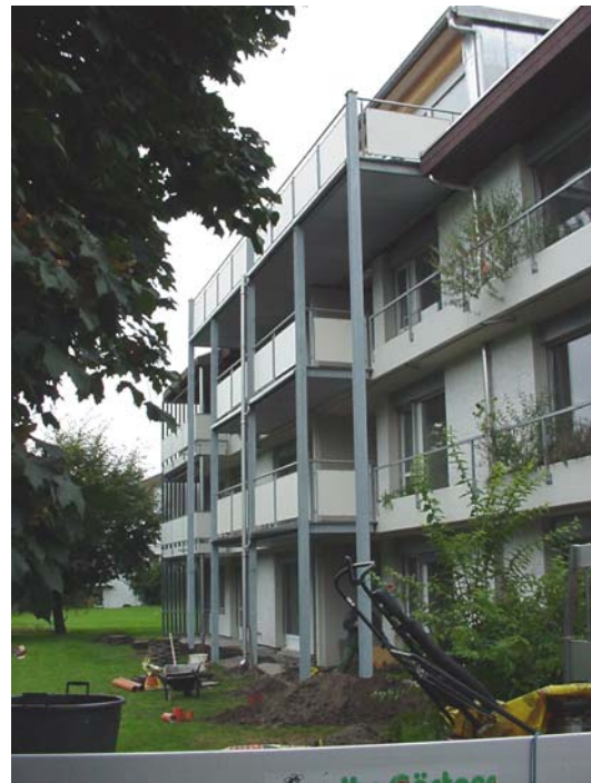
Metallbalkone lassen sich mit vielen verschiedenen Bodenbelägen wie Holz, Beton, Verbundplatte oder sogar Glas kombinieren.