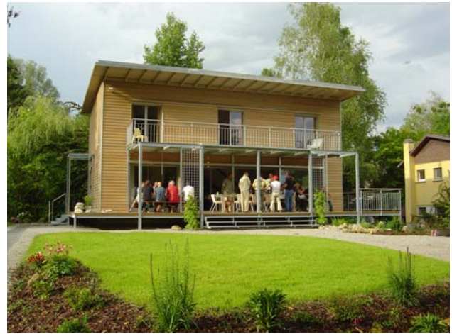
Mit Metall lassen sich sehr filigrane und moderne Balkone und Terrassen realisieren.